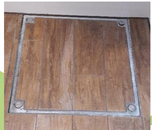
Abbildung 2: SA-VB feuerverzinkte Schachtabdeckung, eckig im Badezimmer verlegt, belegt mit Fliesen über Zisterne