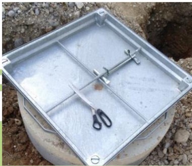
Abbildung 1: SA-VB