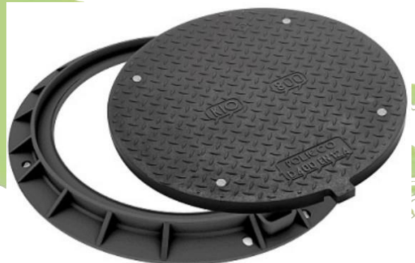
Abbildung 2: SA-KD Kunststoff-Deckel, rund, LKW-befahrbar