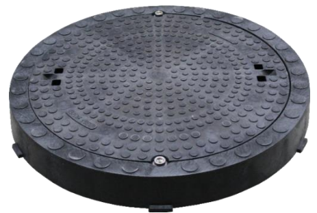
Abbildung 1: SA-KA Kunststoff-Deckel, rund, begehbar