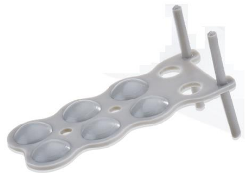
Abbildung 1: SPH-K Stapelplatte

Die Ausführung mit Haken dient dazu, den Abstandhalter leichter zu entfernen.