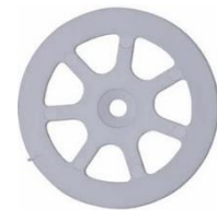
Abbildung 2: Montageteller MT-K 60/5