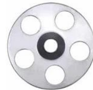
Abbildung 1: Montageteller MT-S 35/5