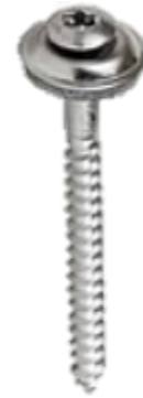
Abbildung 1: Montageschraube M-SPG

Die M-SPG Montageschraube ist eine 3-teilige Holzschraube mit Torx-Linsenkopf, der eine geprägte Tellerscheibe (Rosette) und eine Dichtungsscheibe aufgesteckt sind. Diese werden auch als Spenglerschrauben bezeichnet. Die Schraube und die Rosette sind aus Edelstahl V2A. Der Schraubendurchmesser ist 4,5 mm und wird in Längen von 25, 35, 45, 55, 65, 80, 100, 120 und 150 mm angeboten. Weitere Längen und Zwischengrößen sind auf Anfrage lieferbar.