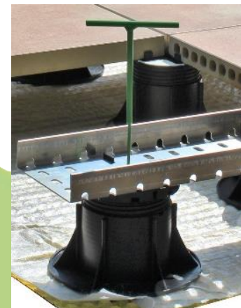
Abbildung 6: Kastenrinne aufgestellt auf Stelzlager SK-V durch Volfiteller VT-B 4/10 als Adapter mit eingesetztem VOLFI Stellschlüssel zur nachträglichen Feinjustierung.