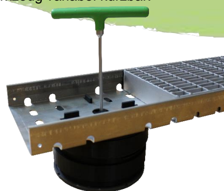
Abbildung 3: VOLFI Gitterrost mit Kastenrinne aufgesetzt auf TL-V Stelzlager