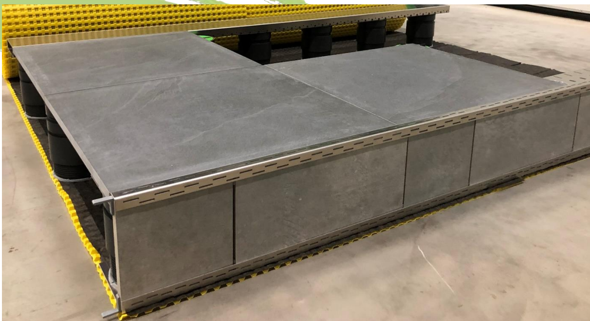
Abbildung 2: Verlegebeispiel VOLFI Alu Stufen-Profil mit ca. 20cm hoher Stufe