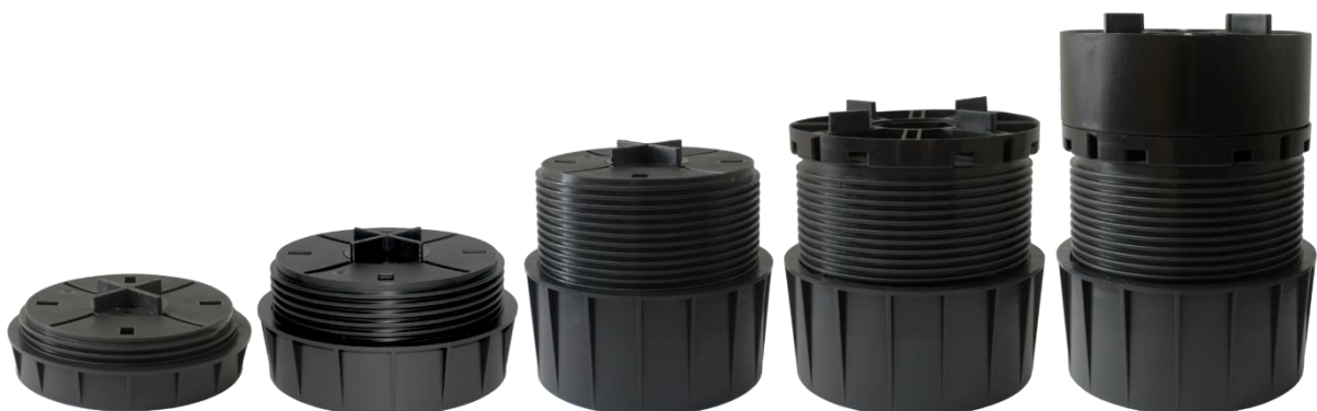
Abbildung 2: Verschiedene Höhen Rundlager RL-V