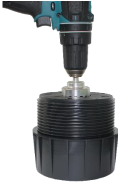
Abbildung 3: RL-V mit Schraub-Adapter ZRV-A

VOLFI – Systeme für die moderne Plattenverlegung