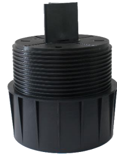
Abbildung 5: RL-V mit eingelegtem FK-BT 5/52