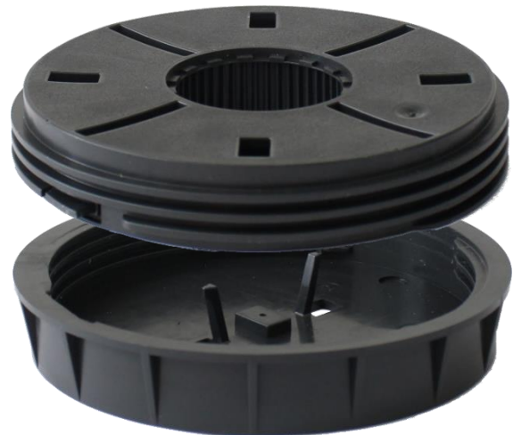
Abbildung 1: RL-V Ober- und Unterteil unmontiert

Der mehrteilige Aufbau mit separatem Abstandhalter ( FK-B/BT/BI ) ermöglicht ein Feinjustieren der Höhe auch bei Auflage von Belagsplatten. So lange das Stelzlager noch seitlich per Hand erreichbar ist.