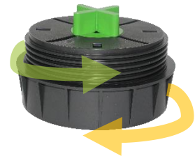
Abbildung 4: RL-V mit eingelegtem FK-B 6/22