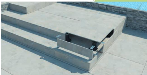
Abbildung 3: Anwendungsbeispiel Stufenclip-Set