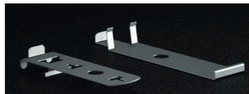
Abbildung 1: Stufenclip-Set Ober- und Unterteil

Das Oberteil wird auf das Dreh-Stelzlager gesetzt und die Stufenplatte wird unten in die Klemmstege des Oberteils eingefasst. Dann wird das Unterteil unter das Dreh-Stelzlager gesetzt und die Platte wird zwischen den Klemmstegen des Unterteils eingefasst.