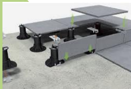
Abbildung 4: Verlegebeispiel Stufenclip-Set

Mit dem Stufenclip-Set erhält man Treppenstufen-Konstruktionen im Plattendesign bei einfacher Montage und geringen Kosten.