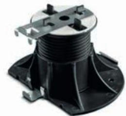
Abbildung 2: Stufenclip-Set an Stelzlager montiert