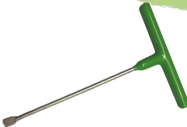
Abbildung 2: Stellschlüssel Premium Plus

Material: geschmiedeter, gehärteter Spezialstahl mit gummiüberzogenen Griff und Silberlackierung