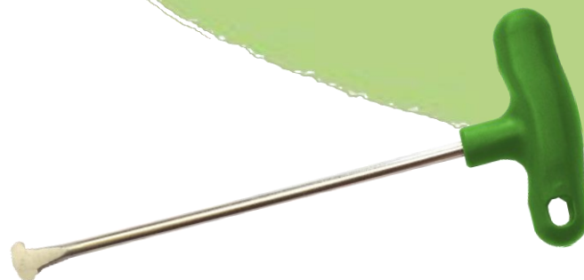
Abbildung 3: Eindrehhilfe Light Plus

Material: verzinkter Stahl mit Kunststoffgriff