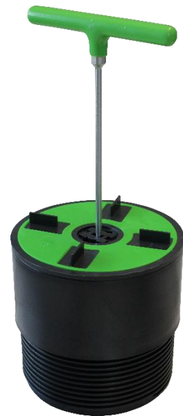
Abbildung 1: Stellschlüssel Premium Plus zum nachträglichen feinjjustieren der Dreh-Stelzlager TL-V

Er wird in Deutschland in Handarbeit geschmiedet und ist mit einem Weichgummi am T-Handgriff überzogen, damit man bei der Montage kräfteschonend arbeiten kann. Außerdem wird der Stellschlüssel komplett für den professionellen Dauereinsatz auf der Baustelle gehärtet.