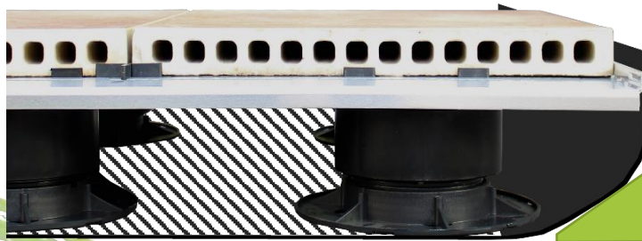
Abbildung 1: Speziell auf Abdichtungen kommt es im Randbereich oft zu Wulsten oder Schrägen, wegen der keilförmigen Verklebung. Diese Stellen lassen sich ideal mit den RWK überbrücken.

Auflagekonsole u. Randhalter aus extra stabilem 3mm Alu für die Plattenverlegung im Randbereich. Durch den Einsatz dieser Konsole werden Zuschnitte und Randplatten stabil verlegt.