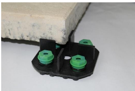
Abbildung 2: VOLFI-SKT-V mit aufgesetzter Betonplatte (Beispielaufbau: 20-25mm verstellbar)

Der VOLFI-Kombiteller ist der Adapter, um das SKT-V auf größere Höhen aufzustocken. Volfiteller 4/10 (mehrfach stapelbar) VT-U10 , VT-B 15 , VT-U 20, 30, 50 können darunter gestellt werden. Ebenso sind die VOLFI-Scheibe 2 mm VS-U/VS-GKU oder VOLFI-Platte 5 und 10 mm VP-U/VP-GKU/VP-N/VPN-GKU (nicht stapelbar) sowie die verstellbaren Stelzlager TL-V oder SK-V für die Montage von unten geeignet. Auf Volfiteller, -Scheibe- und Platte lassen sich jeweils zusätzlich noch Ausgleichscheiben VT-A in 1 und 2,5 mm Stärke legen.