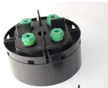
Abbildung 3: VOLFI-SKT-V eingesetzt in Kombiteller KT und erhöht durch VOLFI-Teller VT-U 50mm. (Beispielaufbau: 75-80mm verstellbar)