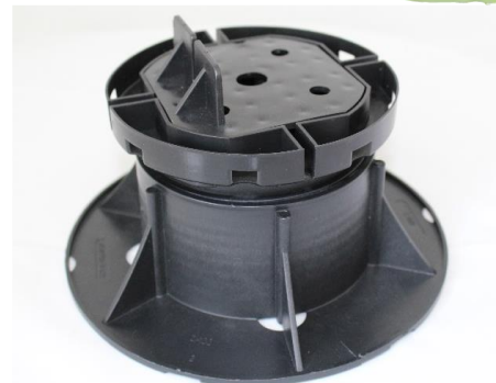
Abbildung 3: WK-L mit Unterbau VOLFI Kombiteller KT und VOLFI Stelzlager SK-V

Zum einfachen, preiswerten Übereinanderstapeln von zwei Volfilagern ist die Stapelklemme WK-UK sowie als Unterteil ein WK-U , mit 4 Stegen und 19 mm Fugenhöhe, erforderlich.