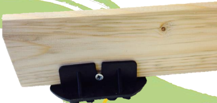
Abbildung 4: WK-L mit beispielhaft angeschraubtem Holzbalken

Das Volfilager kann auch in den Kombiteller KT-N mit 8% Nivellierung eingelegt werden. Aufgestellt auf TL-V oder SK-V wird hier eine flexible Fugenbreite bei größerer Neigungsmöglichkeit und eventuell eine preiswertere Alternative gegenüber dem SK-VN Stelzlager erreicht.