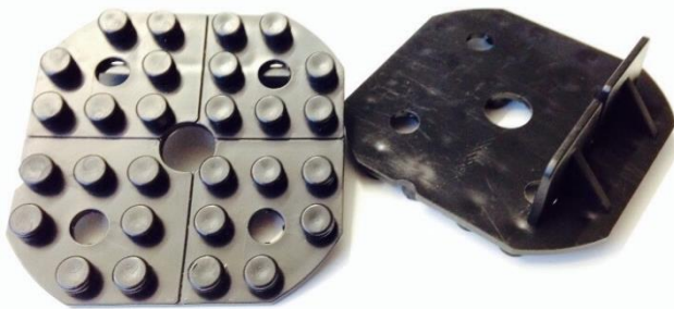
Abbildung 2: Ober- und Unterseite WK-L