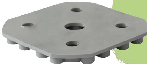
Abbildung 2: GK-U 0/00