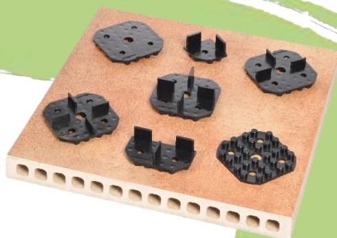
Abbildung 3: Diverse Volfilager

Zur Ermittlung der benötigten Stückzahl steht Ihnen auf unserer Internetseite ein Bedarfsrechner zur Verfügung: www.volfi.de oder die APP VOLFI-Bedarfsrechner