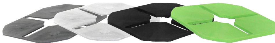
Abbildung 2: Ausgleichscheiben GK-UA in 1,0, 2,0, 2,5 und 3 mm Stärke

Die Scheiben werden in Verbindung mit WK-UR mittig geschnitten.