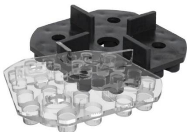
Abbildung 3: TK-U 4/10 im Vergleich zu WK-U 4/10

Für gleichmäßige Fugen im Wandbereich wird der Wandabstandhalter WAE-K mit Klemmnase genutzt. Zusätzlich verhindert er ein „Kippen“ der Platten an der Wand.