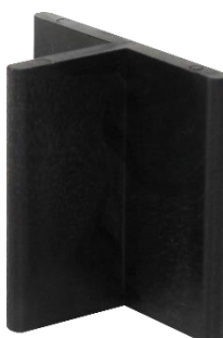
Abbildung 3: FK-T extra hoch